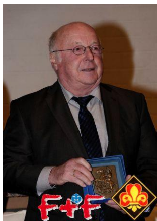
Dr. Norbert Blüm