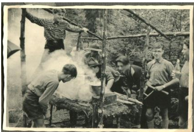
Großfahrt nach Forbach im Murgtal, Schwarzwald (1954)