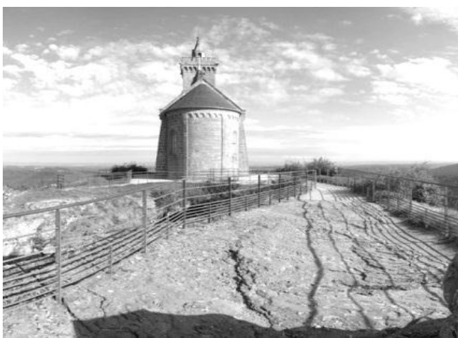
Großfahrt in die Vogesen, hier: Le Roché von Dabo (1974)