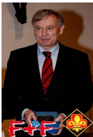
Dr. Horst Köhler